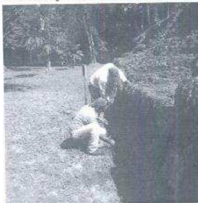
Foto 1. Momento en el que se estaba llevando a cabo trabajo de desyerbe en el Basamento de la Acrópolis Norte