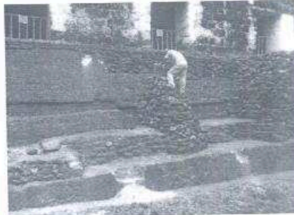
Foto 2. Se muestra el momento en el que se estaba aplicando el reintegro del material del basamento del Edificio 389, Acrópolis Sur

provocó algunos desprendimientos de material constructivo del basamento, lo cual se atendió de inmediato a través de la reintegración del material empleando una mezcla a base de cal para su reintegro.