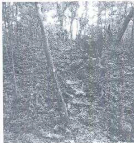
Foto 7. Montículo del sitio arqueológico Paxte durante la visita de campo