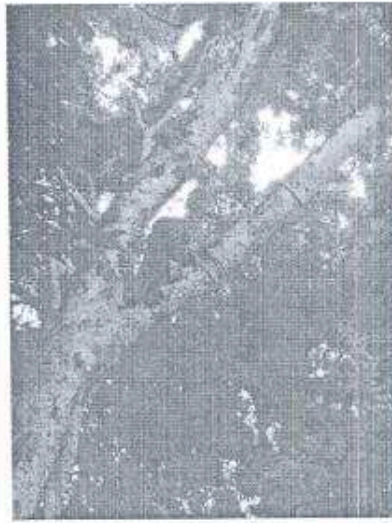
Foto 8. Fragmentos de cerámica que forman parte del material evaluado