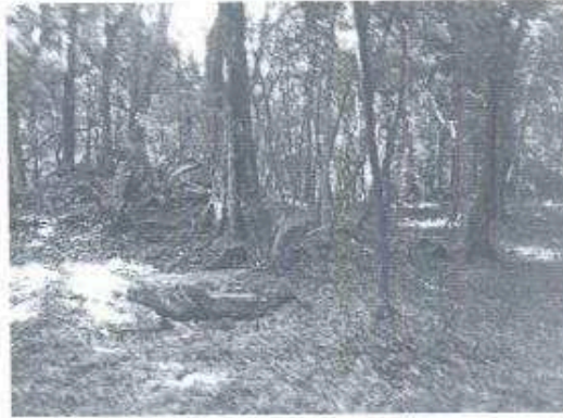
Foto 6. Plaza principal del sitio arqueológico Canté durante la visita de campo